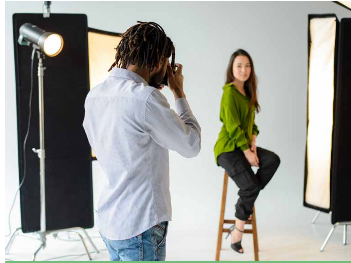
Jornada 4 visiones: el arte del retrato Israel Luri

27 enero - 4 marzo. Horario: 16 - 20h. 80 horas.