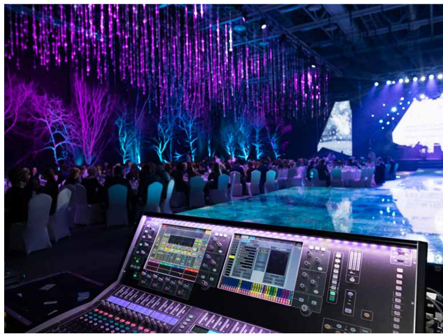
Sonido para eventos en directo Marcos Otero y Sergio Benito

27 enero - 14 marzo. Horario: 9:30 - 14:30h. 165 horas.