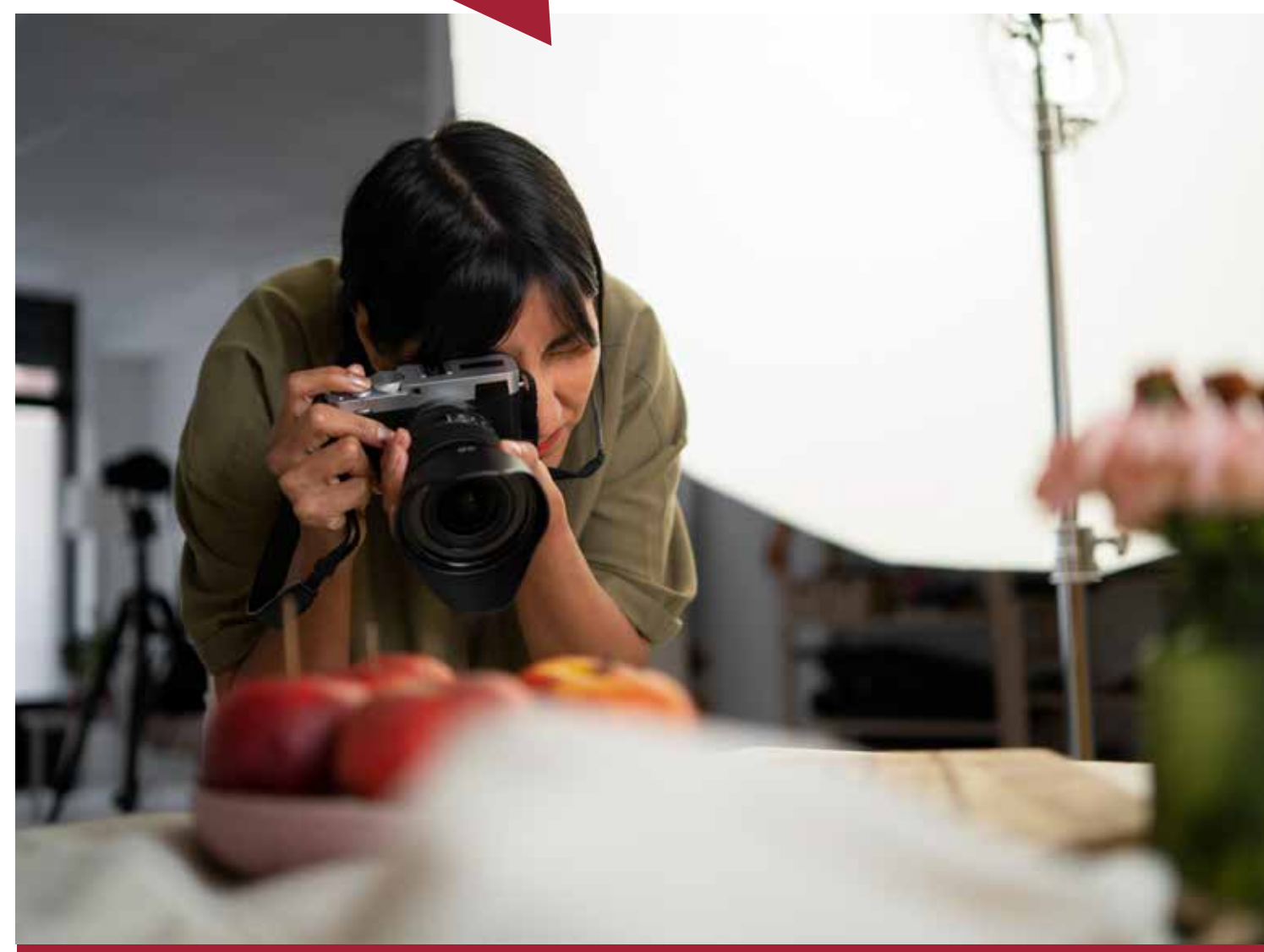
Programa integral de fotografía profesional, edición e impresión Mikel Pikabea, Israel Luri e Inmaculada Ortega

27 enero - 14 marzo. Horario: 9:30 - 14:30h. 165 horas.